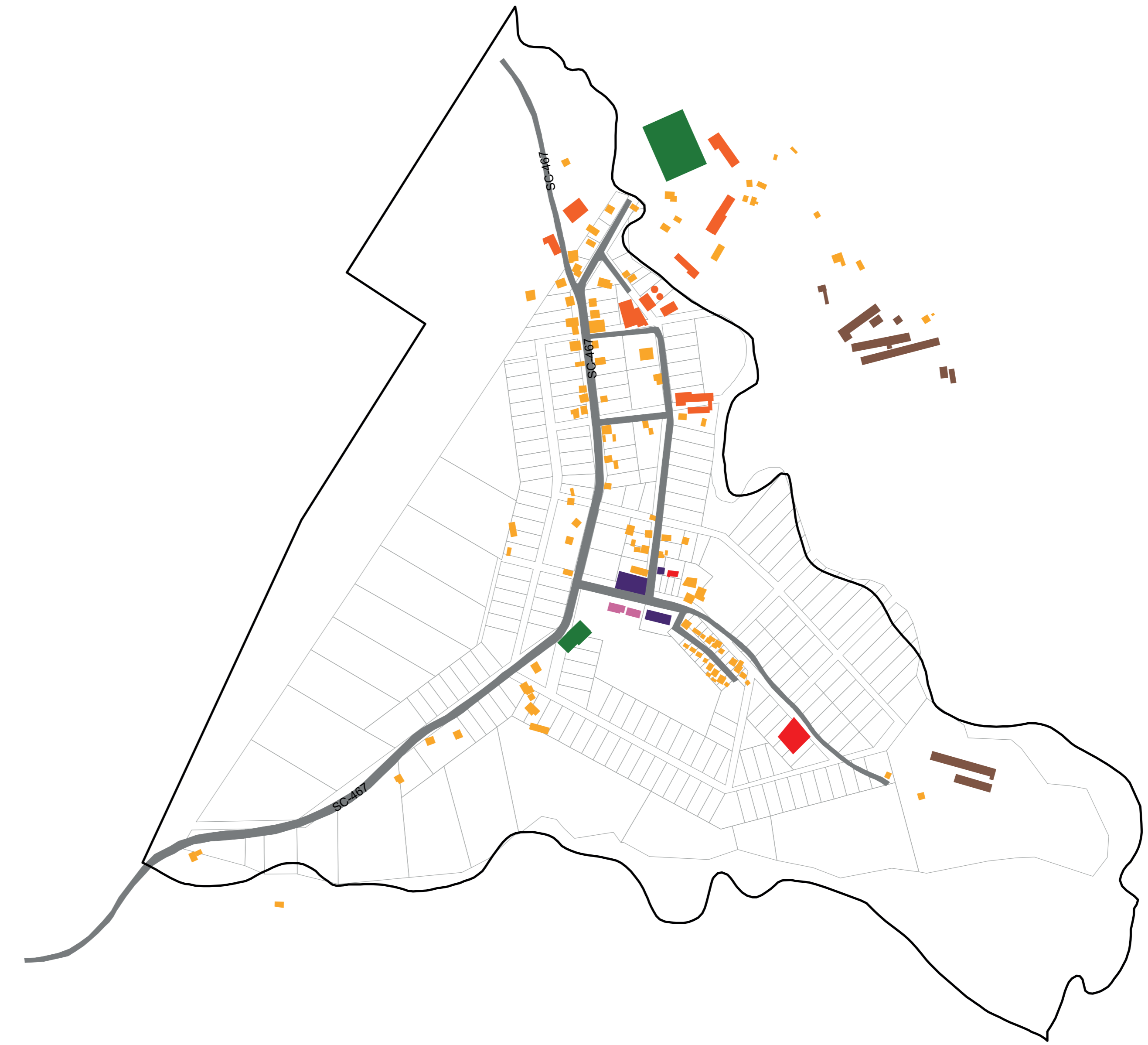
02 - DISTRITO SANTA HELENA