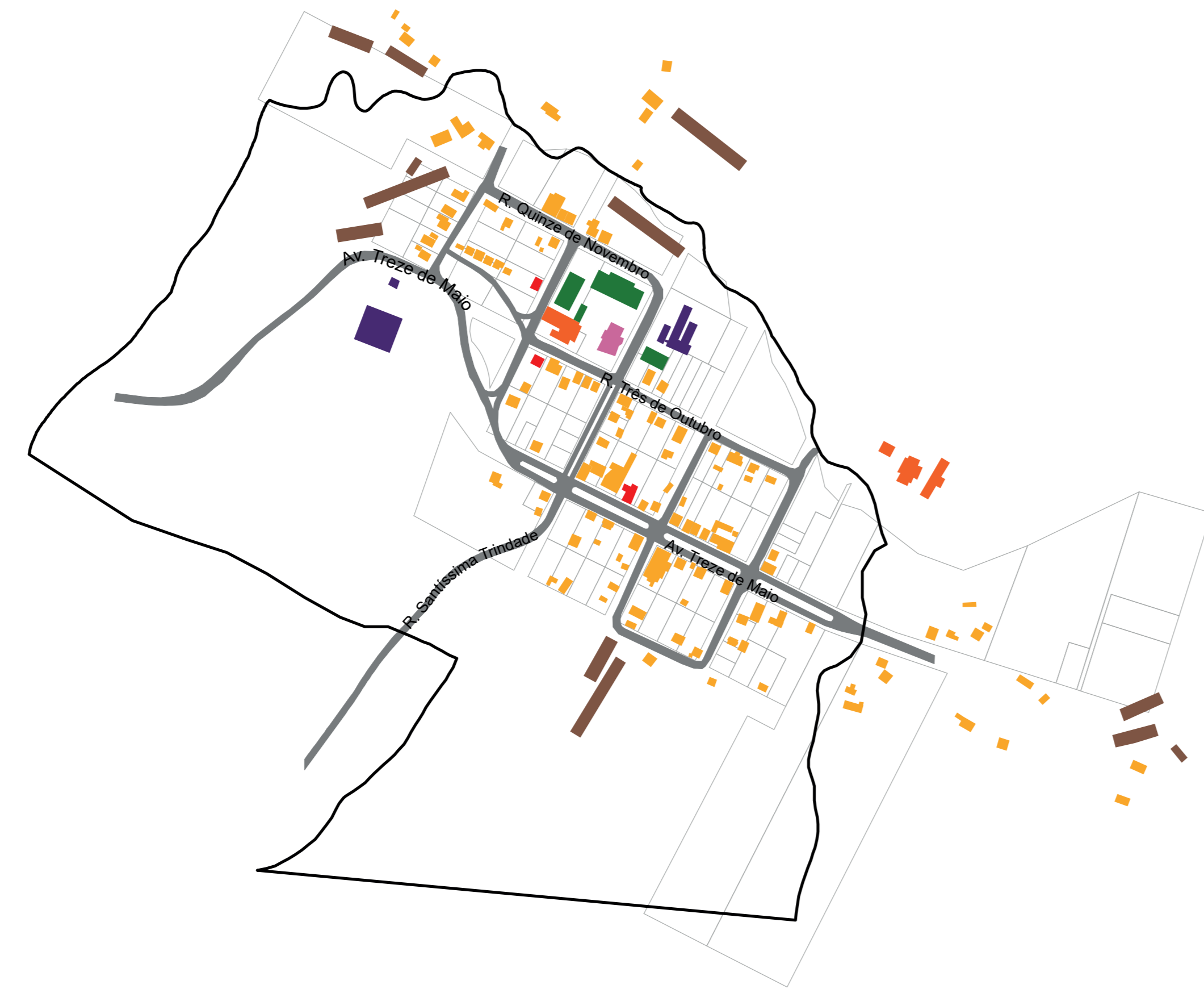
01 - DISTRITO NOVA PETRÓPOLIS